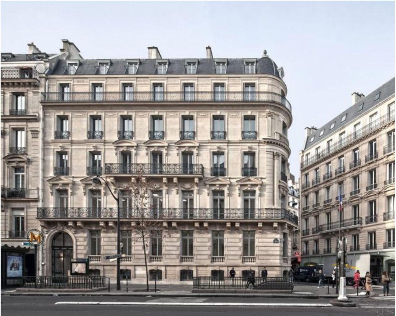
Immeuble haussmannien à Paris